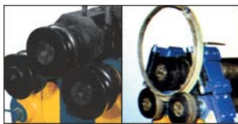
side wheel angle steel bending